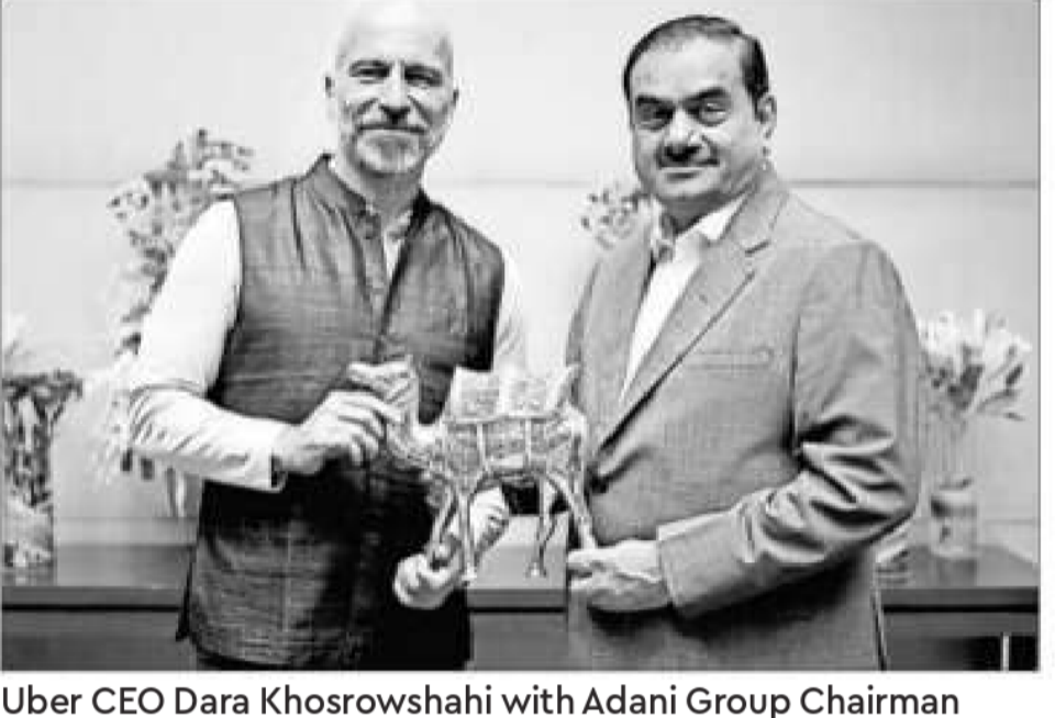
Uber CEO Dara Khosrowshahi with Adani Group Chairman Gautam Adani in Ahmedabad on Wednesday

Posting on social media platform X, Khosrowshahi said the two companies were