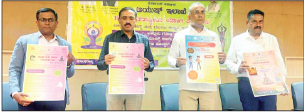
ಬುಧವಾರ ಕೆರೆದಿದ್ದ ಪತ್ರಿಕಾಗೋಷ್ಠಿಯಲ್ಲಿ ಯೋಗ ಅಂಚೆ ಚೀಟಿ, ಅಂಚೆ ಕಾರ್ಡ್, ಫಲಕಗಳನ್ನು ಬಹುಗಡೆ ಮಾಡಿದ ಅರೋಗ್ಯ ಸಚಿವ ದಿನೇಶ್ ಗುಂಡೂರಾವ್ ಈ ವಿಷಯ ತಿಳಿಸಿದರು.

12ನೇ ಅಂತಾರಾಷ್ಟ್ರೀಯ ಯೋಗ ದಿನಾಚರಣೆ ಪ್ರಯುಕ್ತ ಜೂ.21ರಂದು ಏರ್ಪಡಿಸಲಾಗುವ 5 ಸಾವಿರ ಮಂದಿ ಯೋಗ ಪ್ರದರ್ಶನ ನೀಡಲಾಗುವ ರಾಜ್ಯಾದ್ಯಂತ ನಡೆಯಲಿರುವ ಕಾರ್ಯಕ್ರಮದಲ್ಲಿ 25 ಲಕ್ಷ ಜನರು ಸೇರುವ ನಿರೀಕ್ಷೆಯಿದೆ.